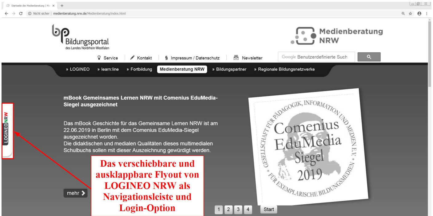
Abbildung 2: Integration des Flyouts auf einer Homepage

In diesem Fall ist es zudem empfehlenswert, dass das Flyout mit Auslieferung der Instanz bereits in der Homepage integriert ist, um den Zugang zu Ihrer LOGINEO NRW-Instanz und die Navigation zwischen den einzelnen Modulen zu vereinfachen (siehe unten).